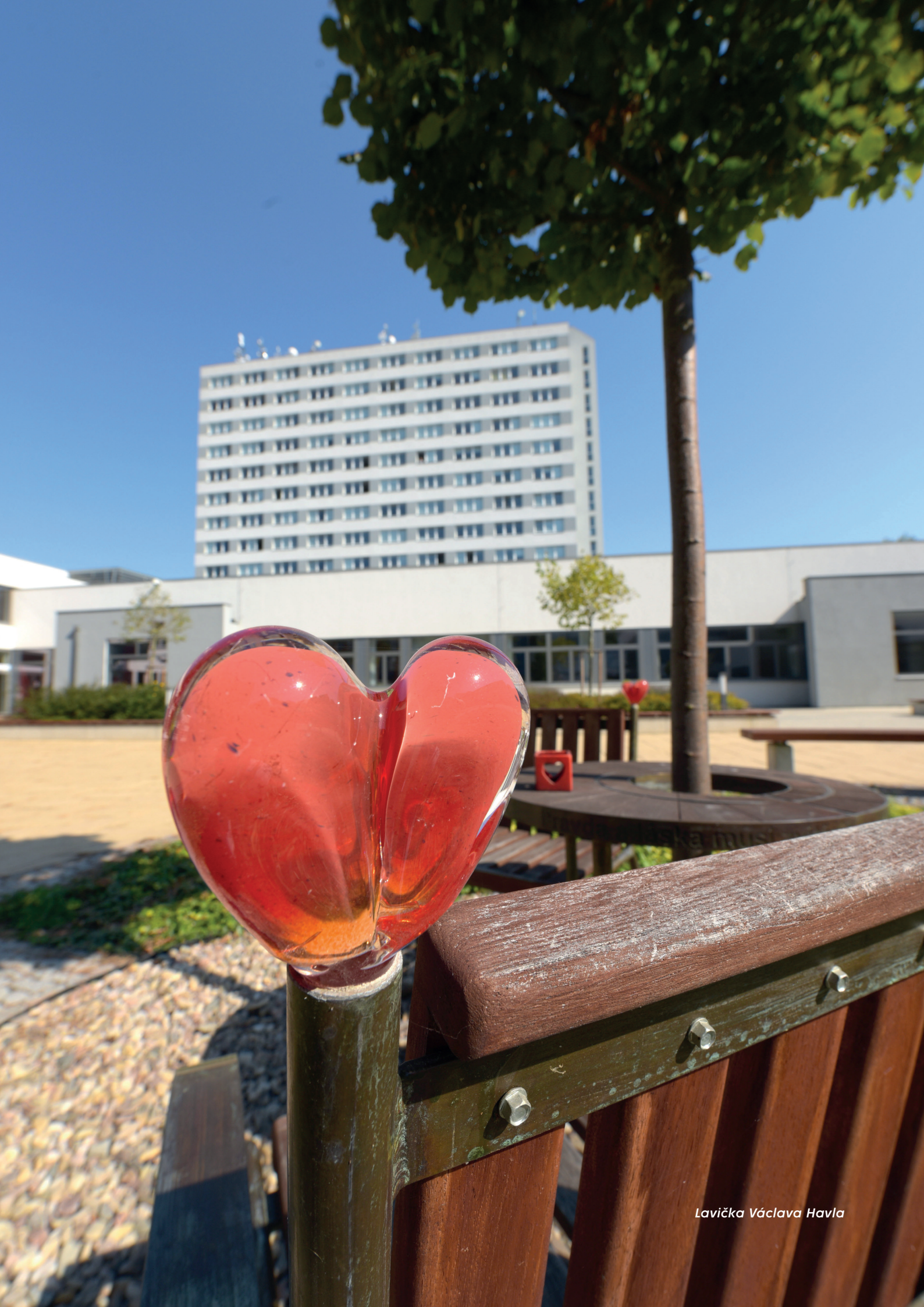
Lavička Václava Havla